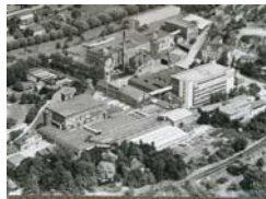
Die J.F. Adolff AG um 1960.