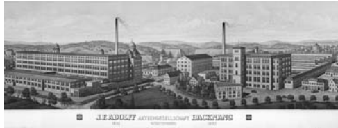
Die J.F. Adolff AG um 1932.

War die Firma J.F. Adolff anfangs auf lokale Auftraggeber angewiesen, erschloss sie sich ab 1860 mit neuen Baumwollgarnen einen überregionalen Kundenkreis. Dampfkraft ersetzte die Wasserkraft. Neue Energiequellen und moderne Maschinen ermöglichten weiterhin der Firma Adolff eine stürmische Entwicklung zu einem der großen Textilkonzerne Deutschlands.