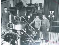
Die 600 PS Sulzer Dampfmaschine.