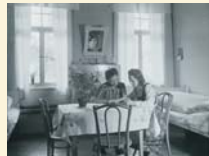
Bewohnerinnen im Marienheim.

Soziales Engagement war bei der J.F. Adolff AG sehr ausgeprägt. Es gab eine Kindergrube, einen Betriebskindergarten und eine Krankenstation.