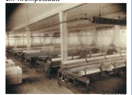
Einer der vielen Selfaktorsäle.

Nach Zerteilung des Faserflors zu Bündchen wurden diese auf dem Selfaktor zu ge-drehten Garnen versponnen. Der Selfaktor war die wichtigste Spinnmaschine des 19. Jahrhunderts.