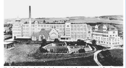
Werk Steinbach mit Marienheim um 1912. Im Vordergrund Gemüsegarten für die Werkskantine.