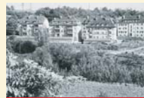
Werkwohnungen für Mitarbeiter.

Werkwohnungen, Werksbad und Werksküche, eine Bücherei und Sportanlagen standen ebenfalls zur Verfügung. Das Marienheim wurde speziell als Wohnheim für Mitarbeiterinnen bereitgestellt.