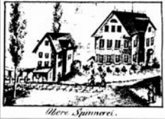
Die Spinnerei um 1840.