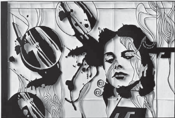
Papierschnitt, 2020, 50 x 70 cm

Es wird darum gebeten, sich über die zum Zeitpunkt der Eröffnung geltenden Hygienevorschriften und pandemiebedingten Zugangsbedingungen der Veranstaltung kurzfristig auf der Homepage der Galerie, www.galerie-der-stadt-backnang.de , zu informieren. Sollte eine reguläre Eröffnungsveranstaltung mit Ansprachen nicht möglich sein, wird die Ausstellung am gleichen Tag um 17:00 Uhr ohne Veranstaltung als „soft opening“ starten, sofern die Corona-Regelungen dies zulassen.