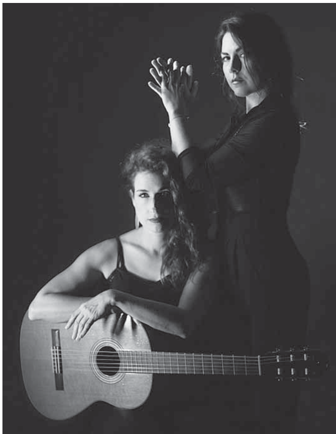
Lydie Fuerte – Gitarre, Eva Luisa – Tanz

Bei dieser stimmungsvollen Show erleben die Besucherinnen und Besucher die kreative Zusammenarbeit der französischen Weltmusik-Gitarristin Lydie Fuerte mit der Tänzerin Eva Luisa, die ihre einzigartige künstlerische Verbindung mit dem Publikum teilen. Die von Lydie erzeugte intensive Klangwelt und die beeindruckende Tanz-Performance von Eva Luisa erwecken insbesondere den Flamenco auf mitreißende und gleichzeitig intime Art zum Leben.