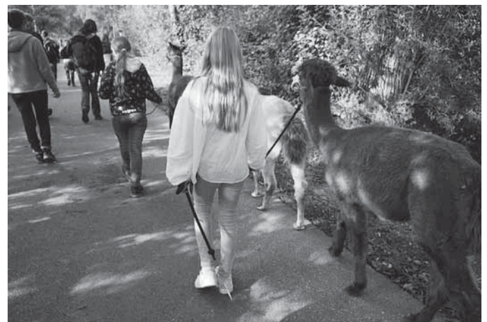
Bärchen (12) bildet mit seiner blonden Begleiterin das Schlusslicht der Karawane. Vier Alpakas und zwei Dutzend Menschen wandern von der Waiblinger Waldmühle aus entlang der Rems.

... ist ein für Patienten und Angehörige kostenloses Angebot und ergänzt die tumormedizinische Betreuung, die zum Beispiel im Onkologischen Zentrum des Rems-Murr-Klinikums stattfindet.