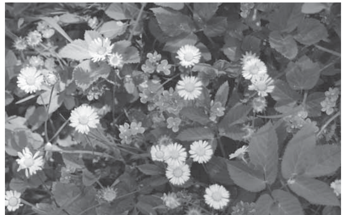
Bildunterschrift: Genussvolle Wildpflanzen am Ebersberg

Weitere Infos unter 0 71 91/ 31 86 53, mit-der-natur@web.de oder www.mit-der-natur.de