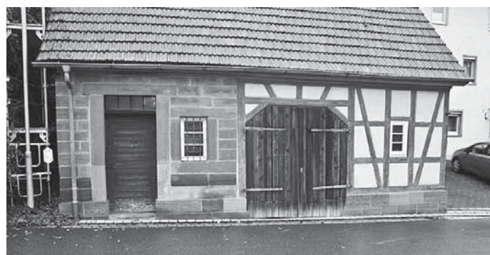
Das erste Heiningen Feuerwehrgerätehaus im Spatzenhof. Blick von Süden. Links das im roten Sandstein gebaute Gemeindeeigene Backhaus.