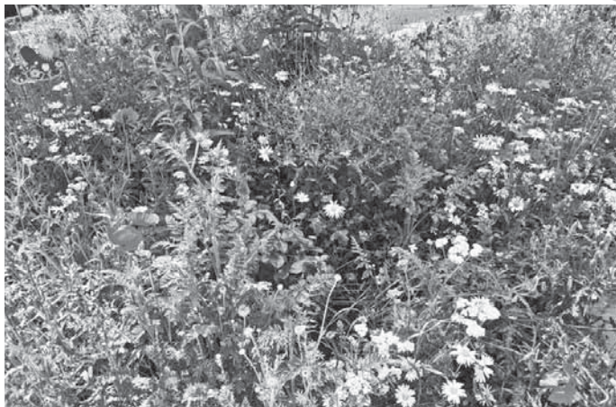
Immer beliebter sind Wildblumen auf Balkonen und in Vorgärten – wie auch bei Wolfgang Wilpert.