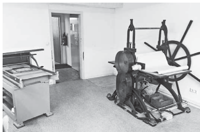
Links Hochdruckpresse und rechts Radierpresse.

Die Presse ist herzlich eingeladen am Sonntag, 28. November, zwischen 10:00 und 15:00 Uhr, den Kursteilnehmerinnen und Kursteilnehmer beim Fortbildungskurs in der Werkstatt im Ölberg 8 über die Schulter zu schauen.