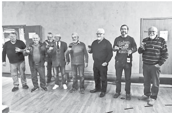
Die zu Ehrenden