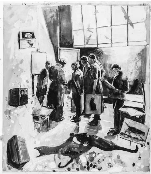
Simone Lucas, Mind and Matter , 2020, 170 x 150 cm