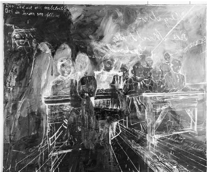
Simone Lucas, Die Schläfer , 2008, 240 x 290 cm