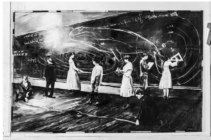
Simone Lucas, Messung , 2010, 230 x 360 cm