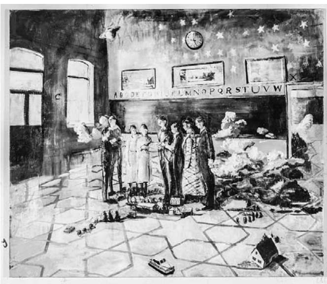
Simone Lucas, Großer Weltentwurf , 2016, 170 x 200 cm

Die herausfordernde Tätigkeit als Amtsleiter des Bauverwaltungs- und Baurechtsamts bei der Stadt Backnang mit ihrer vereinbarten Verwaltungsgemeinschaft übernahm er am 15. Oktober 2010. Die großen Themen seines Berufslebens im Baurecht waren auch die für die Stadt Backnang bedeutenden Bauprojekte mit Umwandlung ehemaliger Gewerbeflächen, wie zum Beispiel den "Dichterberg", das "Baccaré-Areal" und das ehemalige "Feucht-Areal". In den letzten Jahren waren es die Projekte "Kronenhöfe", die Bebauung des ehemaligen Krankenhaus-Areals sowie das Gebiet "Obere Walke".